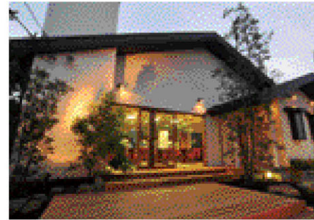
ミュージゼ 埼玉県深谷市緑ヶ丘13-21 TEL.048-574-3914